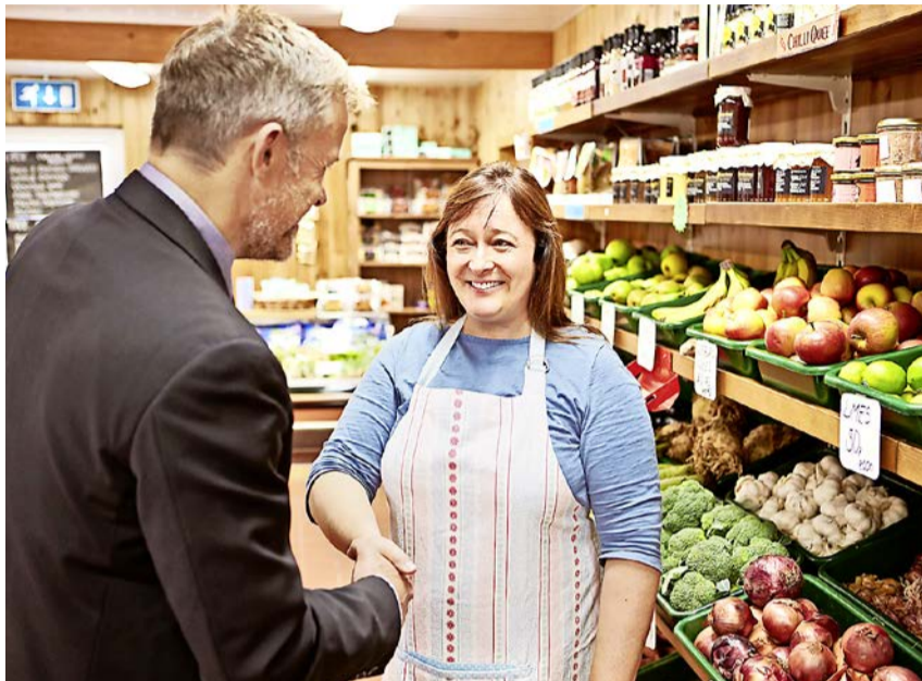
Ein gutes Verkaufsgespräch schafft Atmosphäre.

Achten Sie bei der Preisauszeichnung auf eine gut lesbare Schrift. Schreiben Sie schwarz auf weiss, denn das ist am besten lesbar und wählen Sie eine ordentliche Schriftgrösse. Je übersichtlicher und einfacher man die Preise am Regal auszeichnet, desto besser. Auf den Produktetiketten selbst, sind Kompromisse nötig. Da gehen die vielen Pflicht-