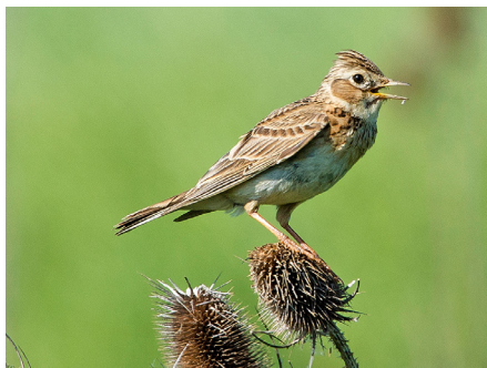
Alouette des champs

Une fauche tardive, comme dans le cas des SPB (après la mi-juin en plaine et après la mi-juillet en montagne), offre à diverses espèces de papillons et d'oiseaux nicheurs la possibilité d'achever leur développement. De plus, la plupart des graminées et fleurs des prairies ont le temps de disséminer leurs graines, contribuant ainsi à la conservation et à la promotion de la biodiversité végétale.