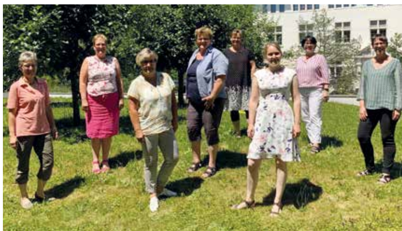
Les membres du comité devant le secrétariat général de l'USPF à Brougg en 2020